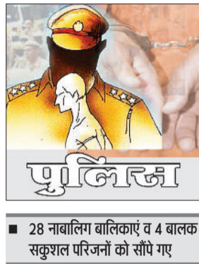
■ 28 नाबालिग बालिकाएं व 4 बालक सकुशल परिजनों को सौंपे गए