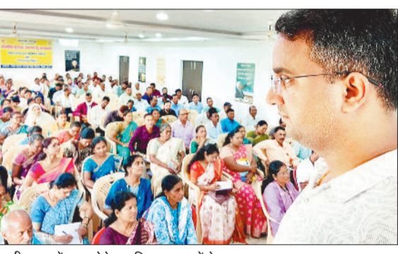
उन्मुखीकरण में भाग लेते प्राथमिक शालाओं के प्रधान पाठक।