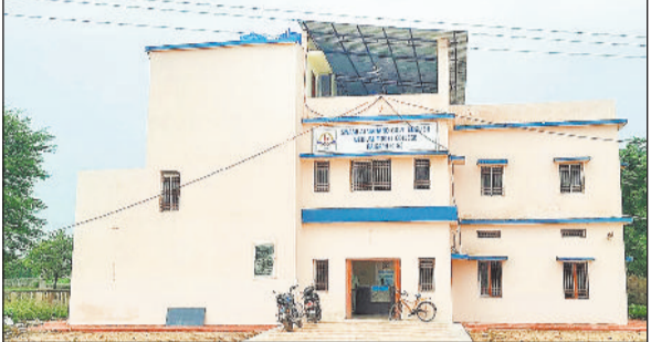
आत्मानंद कॉलेज में सीट और एडमिशन की स्थिति

दरअसल रायगढ़ में आत्मानंद कॉलेज खुले दो साल पूरे हो गए हैं। अब कुछ ही दिनों में इस कॉलेज का तीसरा सत्र शुरू होने वाला है। प्रदेश के पूर्ववर्ती कांग्रेस सरकार ने आनन-फानन में आत्मानंद इंग्लिश मीडियम स्कूल की तर्ज पर रायगढ़ में आत्मानंद इंग्लिश मीडियम कॉलेज तो खोल दिया, लेकिन तब से लेकर आज तक यहां का सेटअप पूरा नहीं हो पाया है। इस