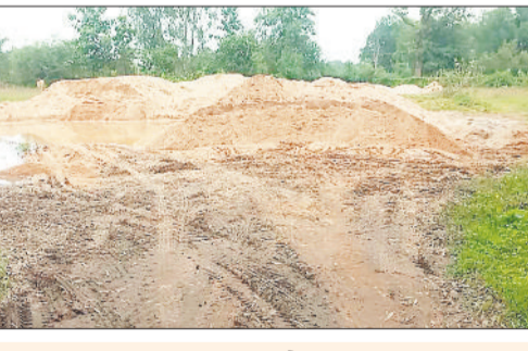
रेत का अवैध खनन एवं परिवहन के दौरान महंगे दामों पर बेचकर मोटी कमाई कर रहे हैं।

सीतापुर। बारिश में रेत खनन एवं परिवहन पर प्रतिबंध लगाए जाने के बाद भी क्षेत्र में रेत माफिया सक्रिय हैं। बारिश थमते ही रेत माफिया आसपास के नदी नालों से रेत का अवैध खनन एवं परिवहन कर रहे हैं। जिसे स्टॉक करते हुए रेत माफिया बारिश के दिनों में महंगे दामों पर बेचकर मोटी कमाई कर रहे हैं। कार्रवाई नहीं होने से रेत माफिया धड़ल्ले से रेत का अवैध कारोबार कर रहे हैं जबकि शासन को करोड़ों के राजस्व की हानि हो रही है जबकि नदी नालों का अस्तित्व संकट में है।