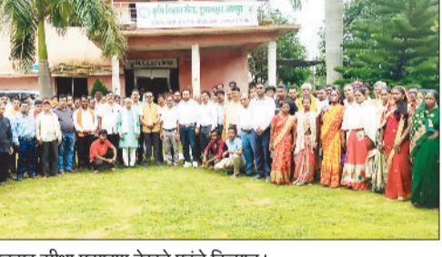
कृषि केंद्र डूमरबाहर सीधा प्रसारण देखने पहुंचे किसान।

प्रधानमंत्री नरेंद्र मोदी ने शनिवार को पीएम किसान सम्मान निधि योजना के 20 वीं किस्त के तहत देशभर के किसानों के बैंक खातों में 20,500 करोड़ रुपये से अधिक की राशि का डिजिटल माध्यम से स्थानांतरण किया। इस अवसर पर जशपुर जिले के 73,555 किसानों के खाते में कुल 15.91 करोड़ रुपये हस्तांतरित